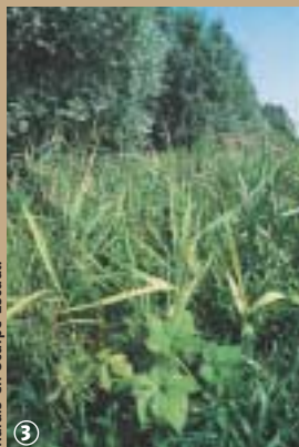
Marais en Scarpe-Escaut.

Les habitants de la Plaine de la Scarpe, à la terre argileuse et gorgée d'eau, ont longtemps souffert des débordements de la rivière. Ce sont les premiers moines, comme Saint Amand, venus évangéliser le pays au VII e siècle, qui entament le travail d'assèchement des terres. Les moines ont la conviction de poursuivre l'œuvre de création divine, c'est-à-dire, la séparation de la terre et des eaux. Pendant longtemps, ils sont restés les maîtres d'œuvre du défrichement et de l'assèchement car seules les abbayes – comme celle créée au lieu dit « Hamage » et qui fut entièrement détruite, comme tant d'autres, à la Révolution – grands propriétaires fonciers, pouvaient financer sur le long terme, ces grands travaux. Leur œuvre majeure, dont les traces sont visibles dans le paysage actuel, est l'édification d'un réseau de petits fossés pour évacuer l'eau et rendre ainsi les terres propres à la culture.