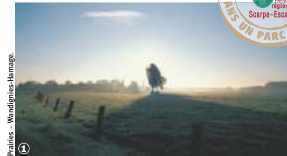
Prairies - Wandignies-Hamage.