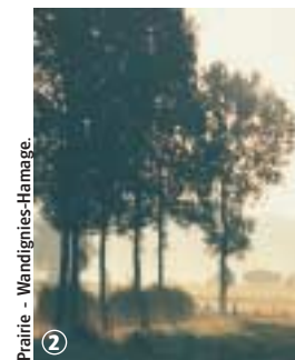
Prairie - Wandignies-Hamage.