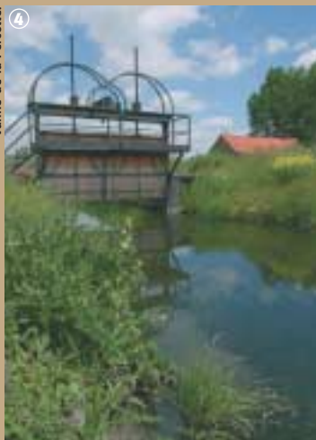
Vanne de la Fercotte.

Mais très vite, ce système montre ses limites, l'assèchement est insuffisant. Dès le XII e siècle et jusqu'au XVIII e siècle, deux grands fossés collecteurs, le Décours et le Traitoire, sont creusés de part et d'autre de la Scarpe, pour porter les eaux stagnantes loin vers l'aval. Ils assurent toujours un rôle essentiel dans l'évacuation de l'eau aujourd'hui.