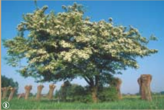
Alignement de saules-têtards taillés et aubépine en fleurs.

trouvent là un lieu idéal pour se loger. Le saule n'est jamais seul : dès qu'une niche est abandonnée, elle retrouve vite preneur – mé-sange bleue ou moineau friquet s'en contenteront amplement, les chenilles et les insectes ne sont pas loin ! Les troncs évidés et remplis de terreau servent aussi d'abris aux hibernants comme le héri-