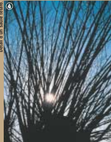
Détail d'un saule têtard.