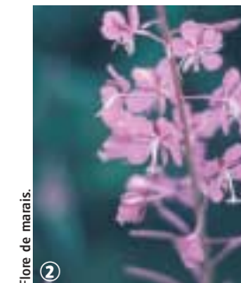
Flore de marais.